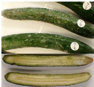
低温障害 (とろけ、果肉褐変)