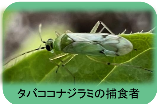
タバココナジラミの捕食者