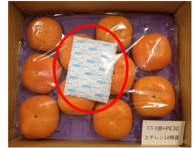
エチレン除去剤(カキ)