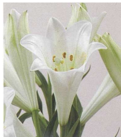
「西尾エクセレント」