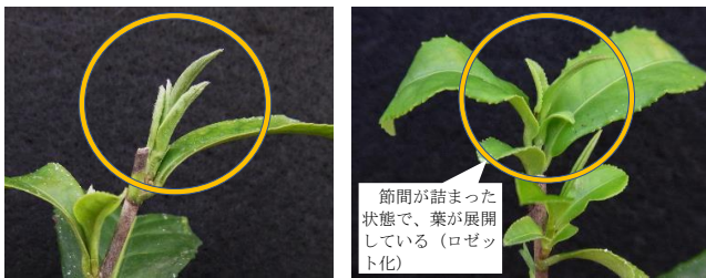
第3図 加温ハウスで生育させた無処理区のチャ「やぶきた」挿し木苗にみられた新梢の節間伸長抑制